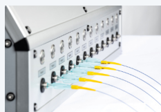
卢尔 (Luer) 接口