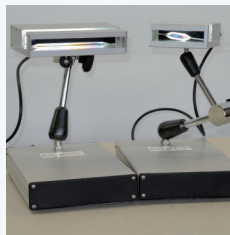
标准机型 80 或 145 mm